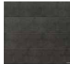
Grigio scuro, strana 9