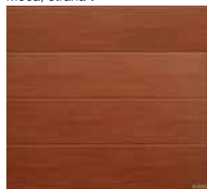
Cherry, strana 14