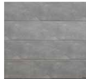
Grigio, strana 8