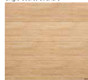
Smrk, strana 16