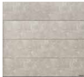
Beige, strana 6