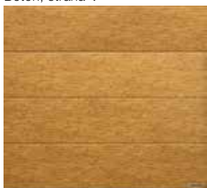
Bambus, strana 12