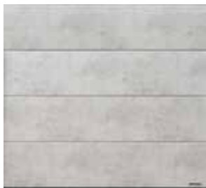
Beton, strana 4