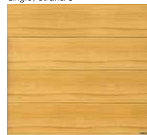
Nature Oak, strana 15